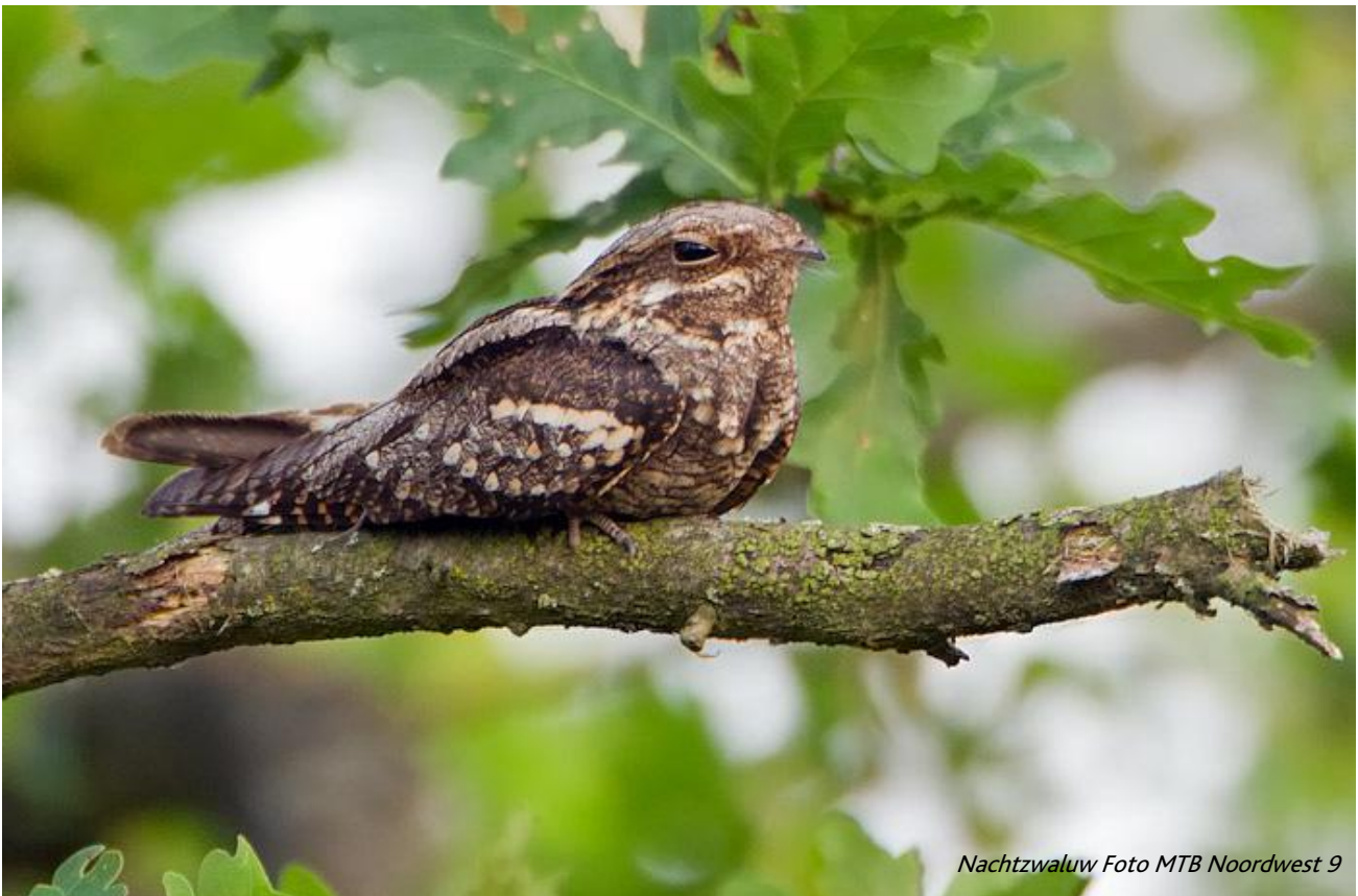
Nachtzwaluw Foto MTB Noordwest 9

Dus hopelijk kunnen we zeggen: tot volgend jaar, je bent meer dan welkom!